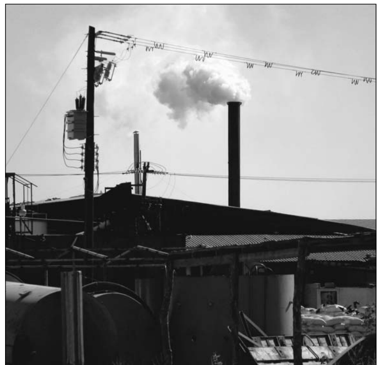
La contaminación industrial en Yavaros no es tanta como la que ocasionan las descargas de aguas negras.

El cobrador que llega a la casa y le pregunta a un muchacho: -¿Tu padre está aquí? -No, le responde el muchacho. Pero el hombre escucha una voz de hombre dentro de la casa. Vuelve y le pregunta: -¿Y tu madre está aquí? -No, le contesta el muchacho. Y el cobrador lo mira y le dice: -Tú si eres mentiroso, yo escucho la voz de un hombre y la voz de una mujer dentro de la casa. -Eso es cierto, pero el problema es que yo no vivo en esta casa.