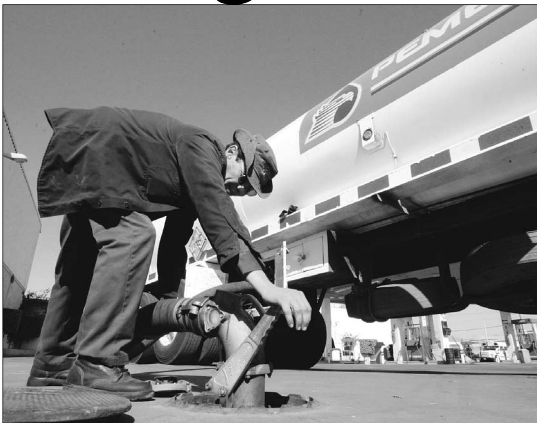
Desde el pasado viernes la gasolinera Soyopa no tenía Magna y apenas ayer era abastecida.

'No hay' El reloj marcaba las 14 horas con 6 minutos. Según comentaron los empleados de la esta-