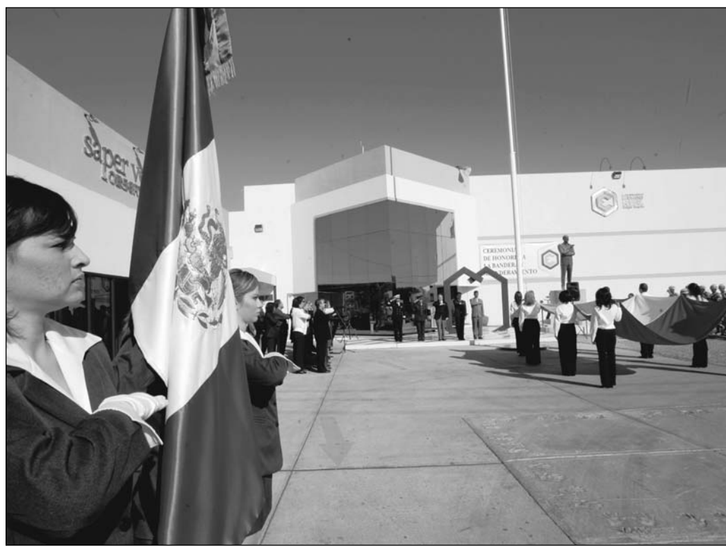
En la explanada de la Multiversidad Mundo Real se realizó el acto del izamiento de la bandera.